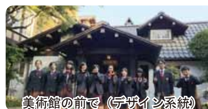
美術館の前で(デザイン系統)