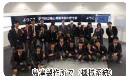
島津製作所で(機械系統)