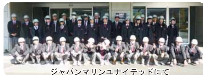
ジャパンマリンユナイテッドにて

10月27日(金)に産業工学科の2年生が、工場見学を行いました。午前中は、舞鶴のジャパンマリンユナイテッド(株)を訪問し、午後からは、機械系統が(株)島津製作所へ、デザイン系統が大山崎山荘美術館へ行きました。ジャパンマリンユナイテッド(株)では、大型のタンカーや貨物船の製造現場を見学し、全員がその大きさに圧倒されていました。また、(株)島津製作所では、最先端の技術による様々な分析機器を実際に体験させていただきながら、会社の製品やその製品がどれほど社会に貢献しているか学ぶことができました。デザイン系統の生徒は、落ち着いたたたずまいを見せる大山崎山荘美術館を思いおもいに見学し、建物と絵画とがトータルにデザインされた独特な雰囲気堪能しました。間近に迫った進路選択に影響する、刺激的な一日になりました。