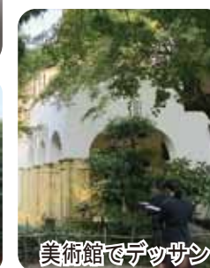
美術館でデッサン